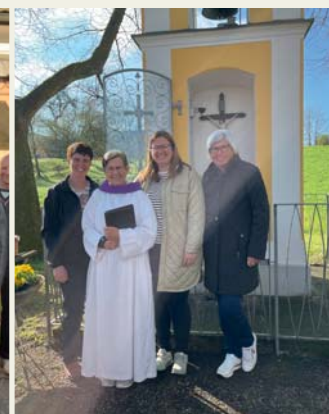
Ostereisensegnungen: Moserannerlkapelle, Zehndorf und Wohlsdorf (v.l.n.r.)