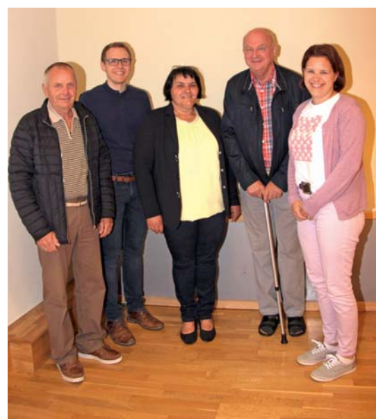
Der neue PGR-Vorstand