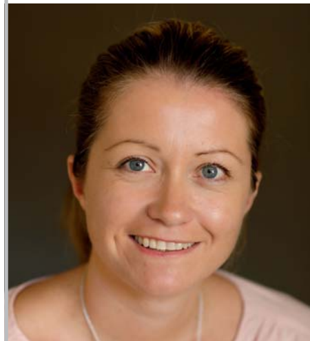
Handlungsbevollmächtigte für Verwaltung

... einer wirtschaftlich ausgebildeten Person – diese trägt in den zuvor festgelegten Pfarren des SR die Verantwortungen und ist Dienstvorsetzte aller Pfarrsekretärinnen.