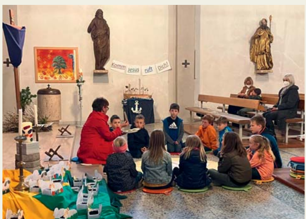
Abendmahlspiel der Erstkommunionkinder am Gründonnerstag

Die Kinder der Nachmittagsbetreuung der VS Wettmannstätten gestalteten den österlichen Bankschmuck für die Pfarrkirche. Wir haben uns sehr darüber gefreut!