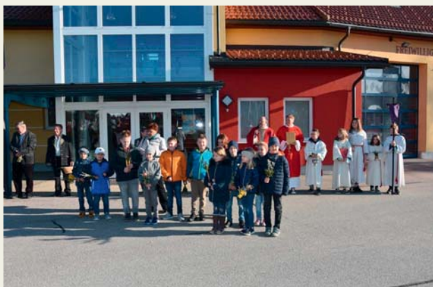
Links: Palmweih beim Rüsthaus