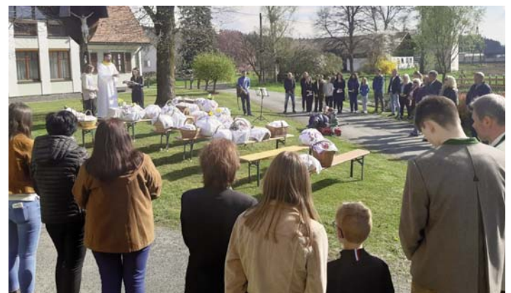
Osterspeisensegnungen in Neudorf (oben), Kraubath (Mitte) und Lebing (unten)