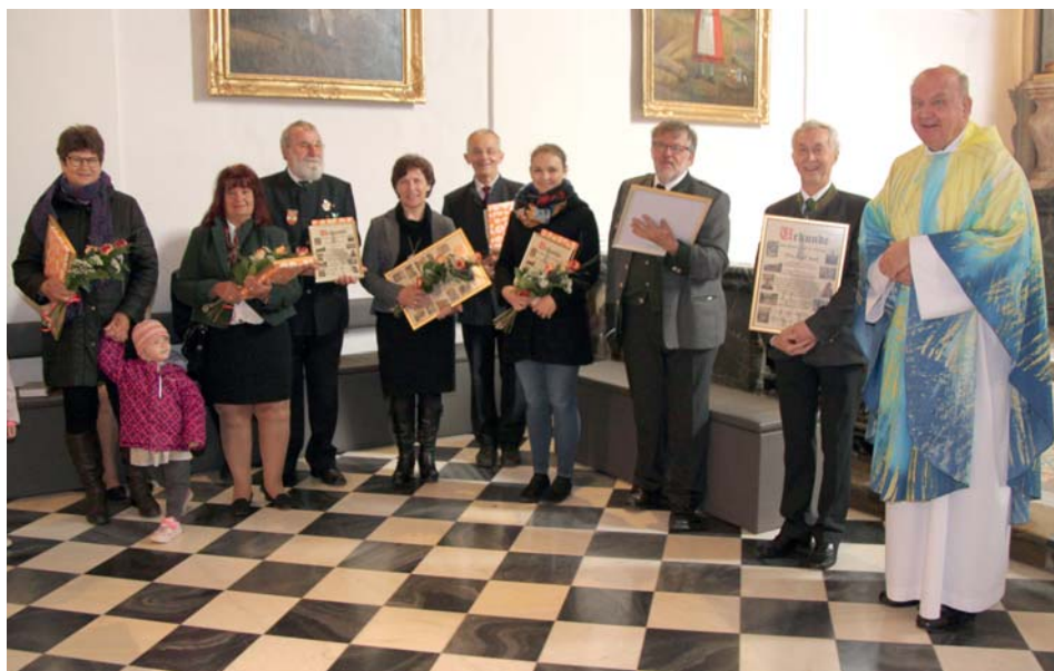
Ehemalige Mitglieder des Pfarrgemeinderats