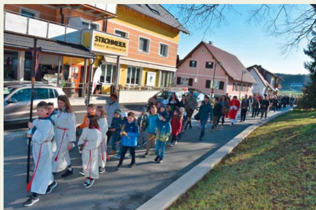
Rechts: Einzug in die Pfarrkirche