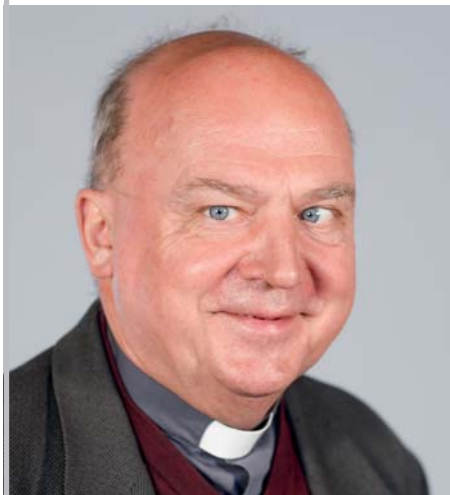
Handlungsbevollmächtigte für Pastoral

... einer theologisch ausgebildeten Person (Pastoralreferent/-in, Diakon, ...) – diese trägt die pastorale Verantwortung für den gesamten SR.