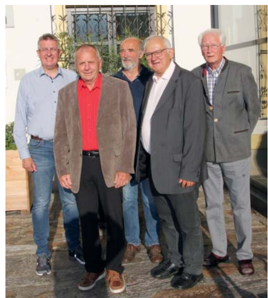
Der neue Wirtschaftsrat