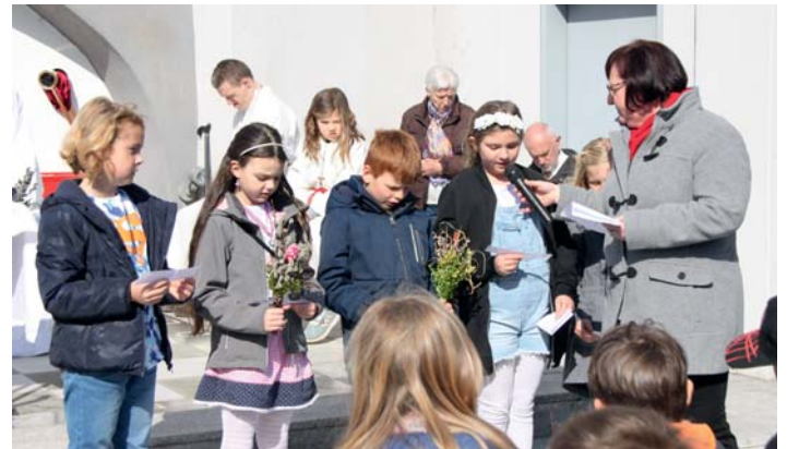
Palmsonntag mit Palmweihe am Ing. Kurt Bauer-Platz