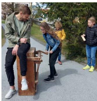
Osterratschen bei der Kirchenstiege