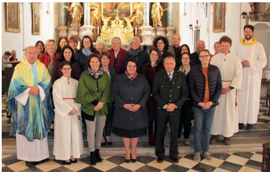
Der neu gewählte Pfarrgemeinderat