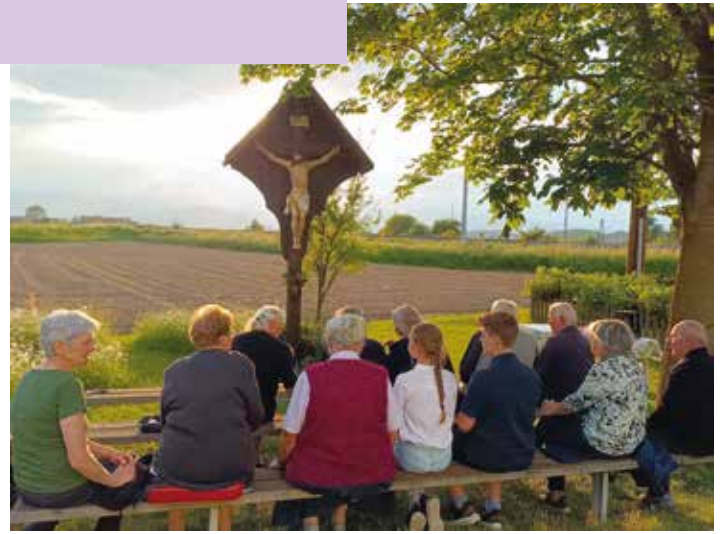
Grünau: Maibeten beim Kar-Kreuz in Kelzen