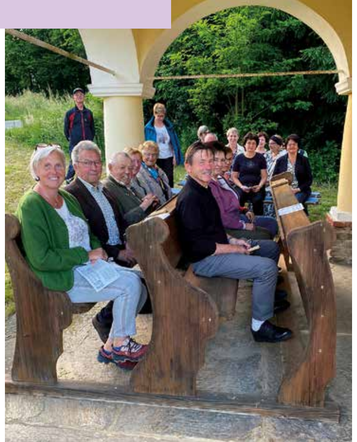
Lasselsdorf bei der Friedlschusterkapelle