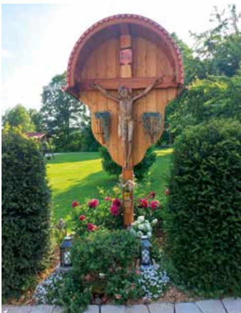
Felderbeten, Wetteramt und Kreuzsegnung in Michlgleinz (Pratlkreuz).

Helmut Zeilinger GmbH Glaserei • Sonnenschutz