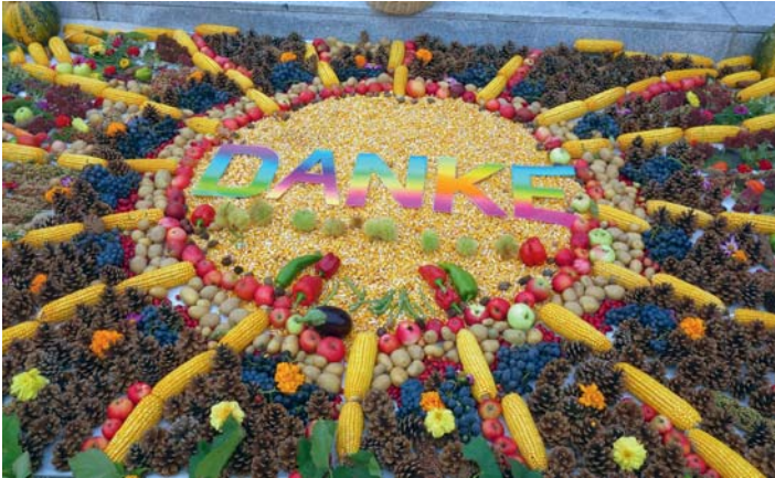
Fotos: „Ernteteppich“ vom letzten Jahr und von der letzten Kinderwortgottesfeier im Juli