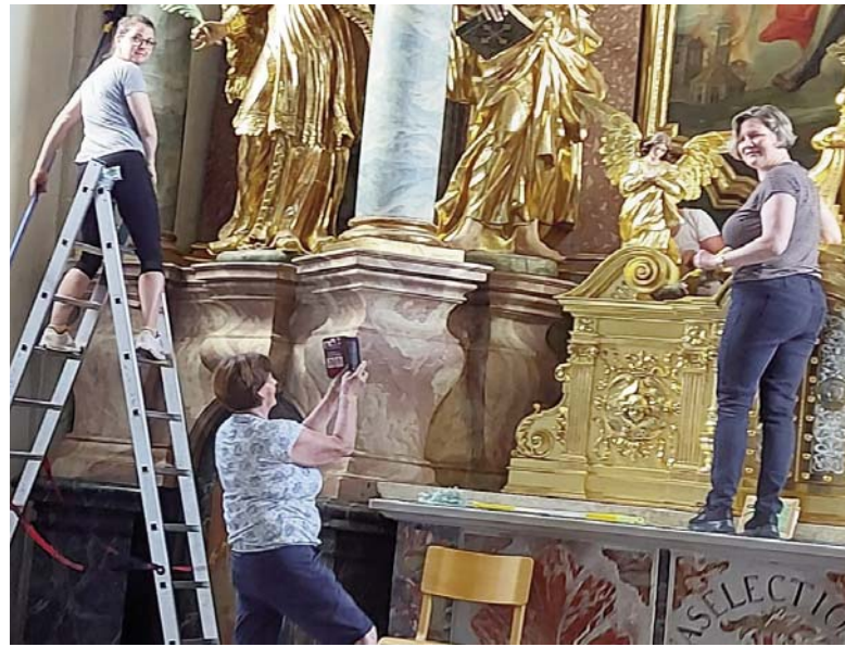
Generalreinigung der Pfarrkirche Ende Juni

Es gibt leider nicht nur Positives, sondern auch Negatives zu berichten. So zum Beispiel vom Friedhof . In letzter Zeit häufen sich die Beschwerden, dass die Gräber durch Hundekot verschmutzt werden. Gleichzeitig wird von diesen Beschwerdeführern vehement ein Hundeverbot für den Friedhof gefordert. Damit aber das Verbot nicht verfügt werden muss, ersuchen wir die Besucher*innen mit Hund bzw.