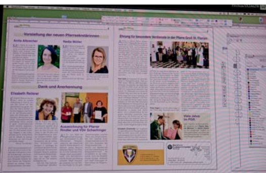
Gestaltung (Layout) am Bildschirm

Offsetdruck: Ab 1973 drängte die neue Errungenschaft den Buchdruck immer mehr in den Hintergrund. Wo damals noch teilweise schwer leserliche, handgeschriebene Manuskripte im Computer heruntergetippt und Bilder eingescannt und bearbeitet werden mussten, ist man heute auf dem modernsten Weg zur Erstellung eines schön gestalteten Druckwerks. Moderne PC und ausgereifte Programme machen dies möglich. Auch unser Pfarrblatt wurde ein paar Jahre später im sogenannten Fotosatz hergestellt. Der Fortschritt machte nicht Halt und der Umfang des Pfarrblattes wurde immer größer. Somit wurde die Idee geboren, ein Pfarrblatt-Team einzurichten, welches sich im Laufe der Zeit einige Male änderte. Mit Absprache unseres Pfarrers Toni Rindler wird dann die Zusage für den Druck gegeben.