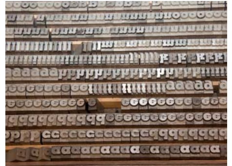
Bleilettern im Setzkasten

in die Druckerei und wurde vom Buchdrucker gedruckt. Anschließend musste die Druckerschwärze auf dem Papier trocknen, ehe die Bögen danach in der Buchbinderei gefalzt, geheftet, beschnitten und verpackt wurden.