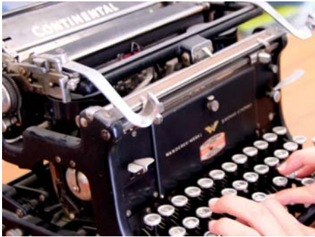
Mit der Schreibmaschine fing alles an