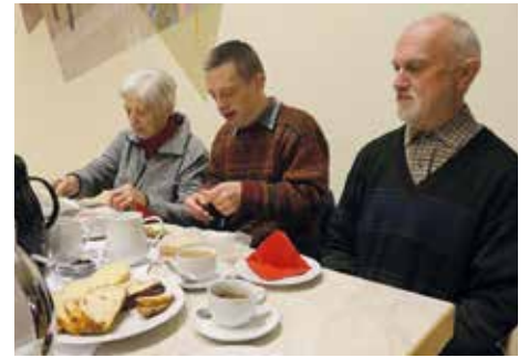
... mit Frühstück