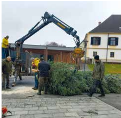
Aufstellen und schmücken des Christbaums