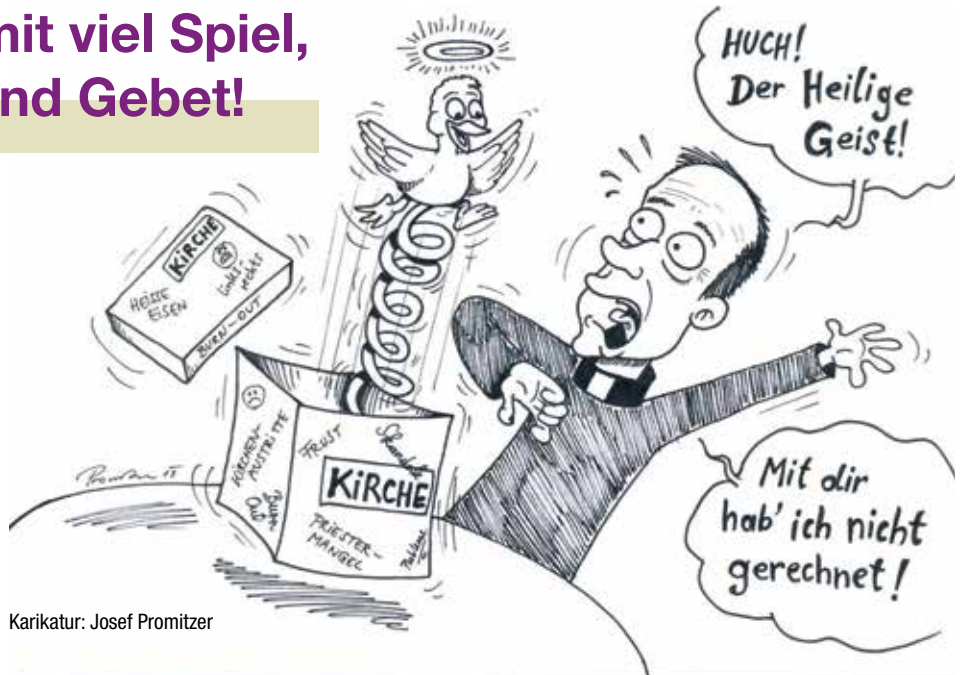
Karikatur: Josef Promitzer