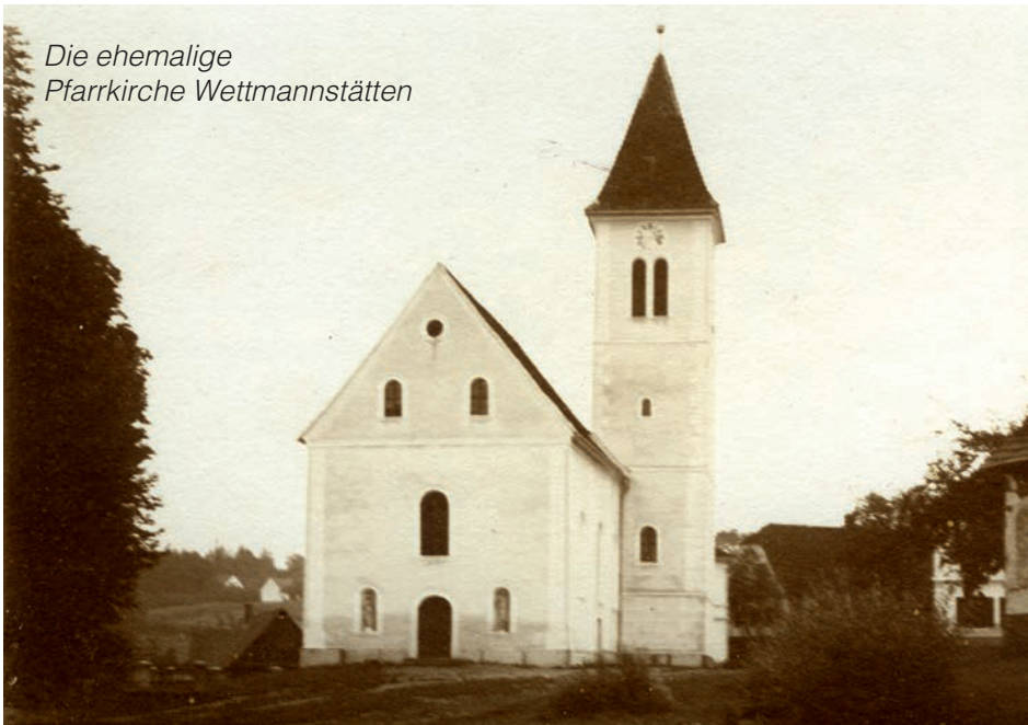
Die ehemalige Pfarrkirche Wettmannstätten