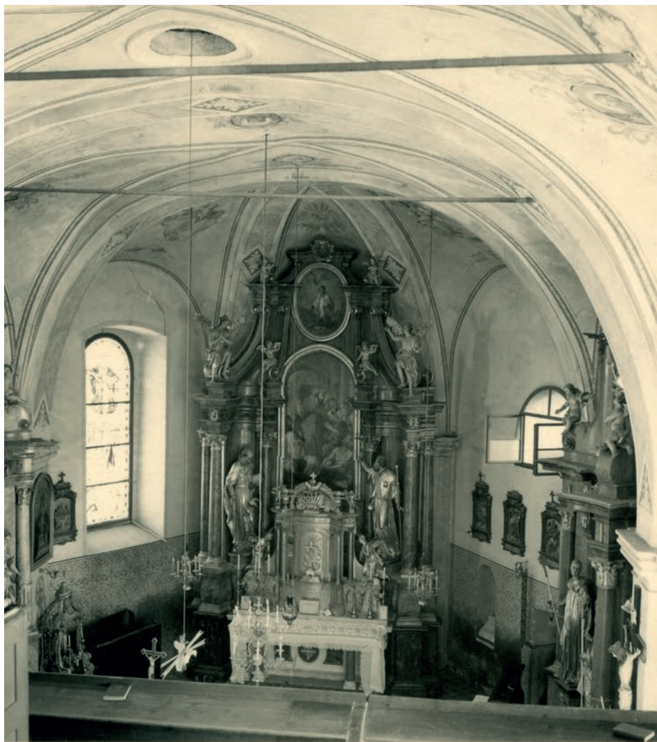
Innenansicht der alten Pfarrkirche, die auf dem Platz des jetzigen Springbrunnens stand. Erbaut von 1712 bis 1718.