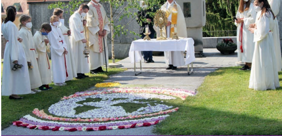
Fronleichnam in Groß St. Florian und Wettmannstätten