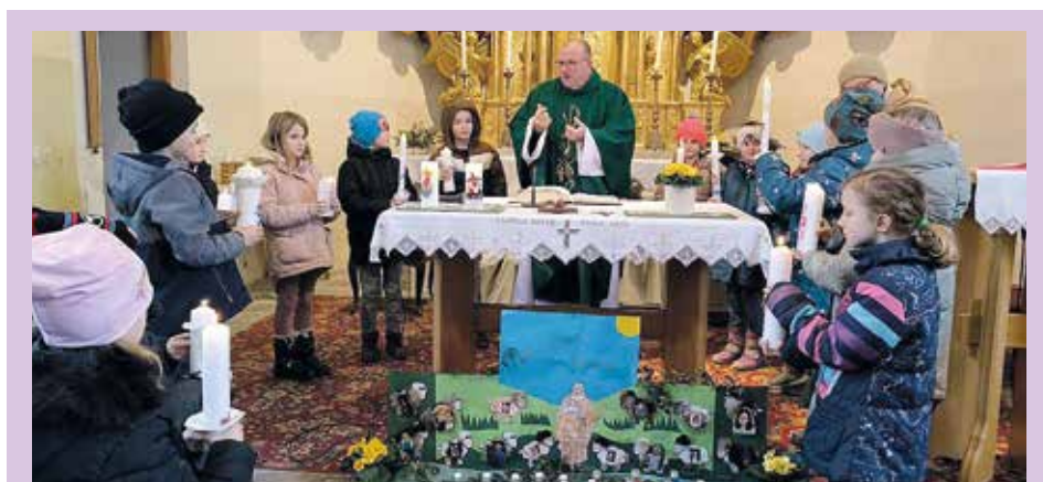
Vorstellung der Erstkommunionkinder in Mettersdorf

Helmut Zeilinger GmbH Glaserei • Sonnenschutz