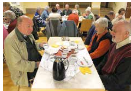
Das Frühstück nach der Rorate