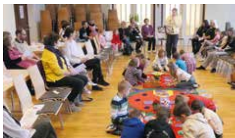
Kinderwortgottesfeier zum zweiten Fastensonntag

Am 2. Februar 2025 feierten wir Jesus, das Licht der Welt . Am 16. März 2025 dachten wir über Gott, den barmherzigen und liebenden Vater nach. Mit Freude und Dankbarkeit erlebten wir, wie groß seine Liebe zu uns ist und wie geborgen wir uns in seinen liebenden Armen fühlen dürfen.