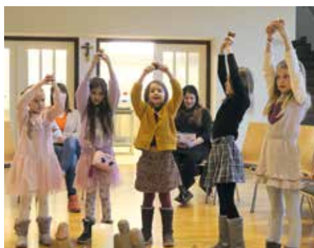
Kinderwortgottesfeier zu Mariä Lichtmess

Die Gärtnerei Haring bescherte der Pfarre Groß St. Florian eine wunderschöne Blumenspende zu Weihnachten.