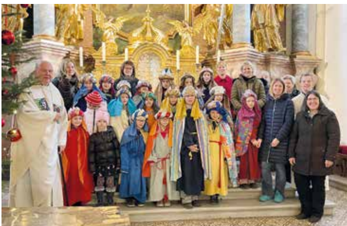
Festgottesdienst am 06.01.2025

Anschließend wurden viele Würstel und Semmeln gegessen und die Band der jungen Kirche lud zum Mit-tanzen ein. Weiters konnten Sternsingerkronen gebastelt werden.