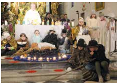
Krippenfeier in der Pfarrkirche