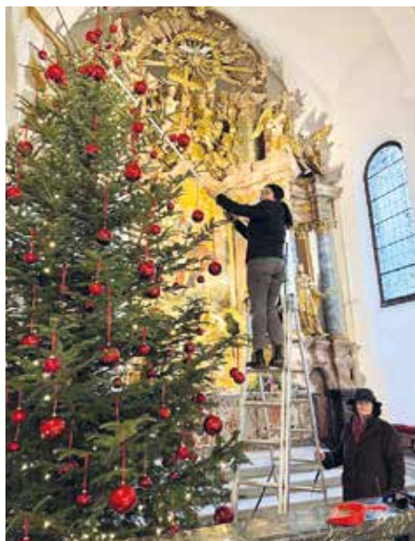
Der Christbaum wird geschmückt